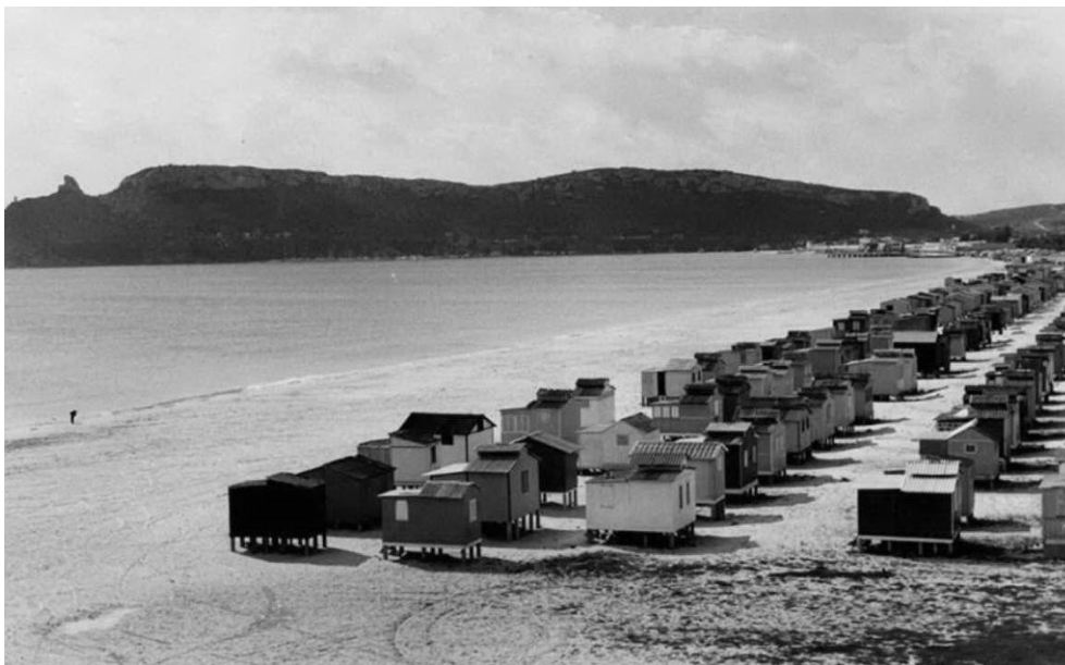
Il Poetto in un immagine di repertorio con i caratteristici casotti

Questa struttura tra documentario e finzione ci accompagnerà fino alla fine di quella giornata del 2017, quando i quattro protagonisti dopo aver ricordato e discusso chiuderanno la barberia, e andranno verso il Poetto, immaginando di ritrovarlo come ne avevano ricordo, e come in qualche modo è stato evocato nelle immagini di repertorio. Naturalmente il Poetto è cambiato, come tutto. Sarà un momento di nostalgia, ma non di rimpianto: i protagonisti staranno in uno dei moderni baretti, a godersi un aperitivo nell'ora del tramonto, quando l'apparizione di un pallone abbandonato sulle dune sarà la scusa per improvvisare una partita. Per tornare giovani come negli anni '60.