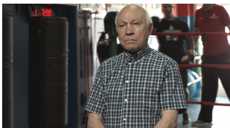
Tonino Puddu – ex campione europeo pesi leggeri – in un fermo immagine dell'intervista.

La Cineteca Sarda ha avviato dal 2011 il progetto chiamato “cinema di famiglia” con il quale raccoglie e custodisce in vari formati, tutti i filmati che raccoglie in forma gratuita da amatori e professionisti. Grazie a questo sta incrementando la videoteca regionale. Il progetto Casteddu Sicsti , sostenuto da subito dalla Cineteca, potrà attingere da questo archivio, ed inserire nel film scene inedite per il cinema.