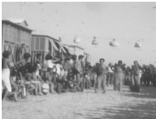
Un'immagine di un video amatoriale fornitaci da Cineteca Sarda. Farà parte del film.